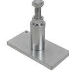
사전 압축 도구